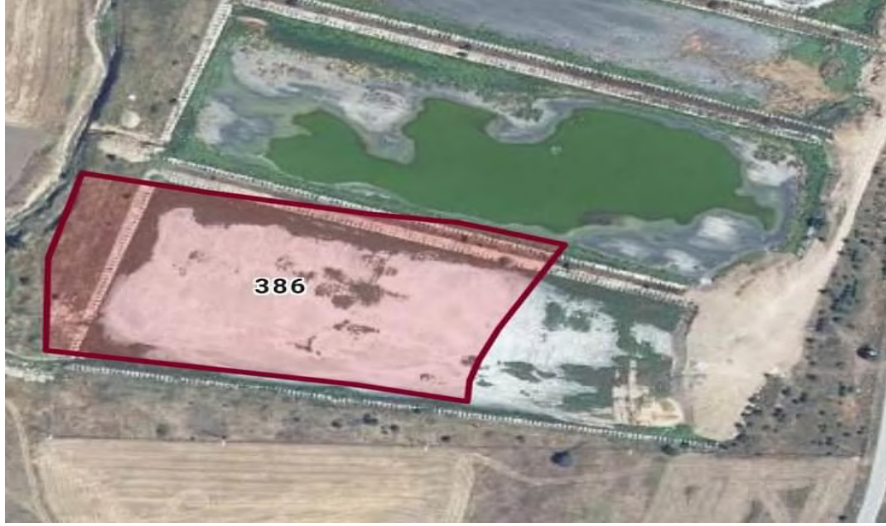
Resim 2. Gerde Belediyesi Güneş Enerji Santrali Proje Sahası

Bölgede yapılan gözlemler dahilinde ortalama sıcaklık 10,90. °C olarak ölçülmüştür. Ortalama sıcaklıklara bakılacak olursa en sıcak ay Ağustos (28,70 °C) ve en soğuk ay Ocak (-2,40 °C) olarak gözlemlenmiştir. Yine aynı gözlem periyodunda maksimum sıcaklığın 42.8 °C olduğu ve minimum sıcaklığın -31,50 °C olduğu ifade edilebilir. Ayrıca yıllık ortalama güneşlenme süresi günde 4,90 saat olmak üzere yılda 1788,50 saattir.