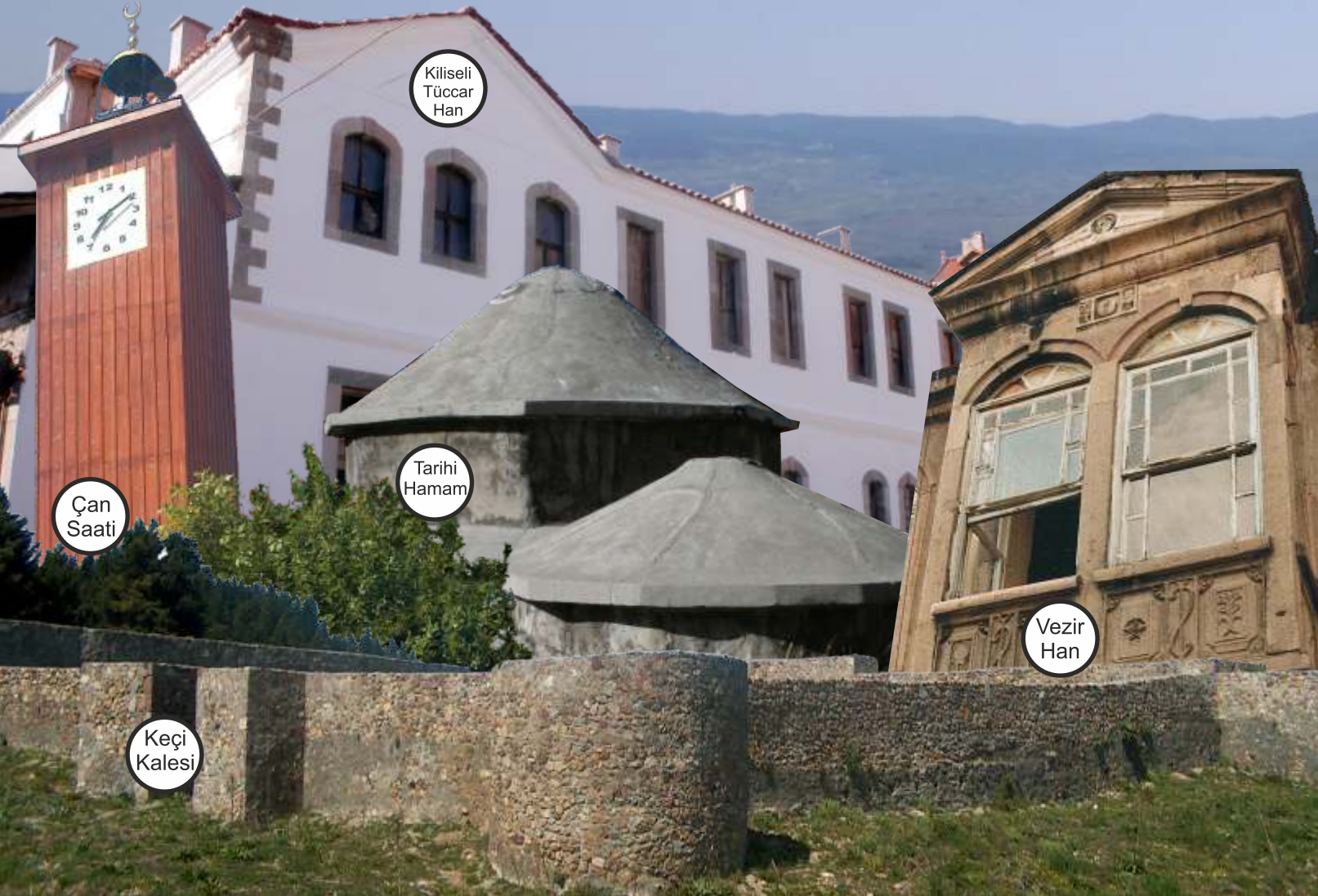
Kılıseli Tüccar Han